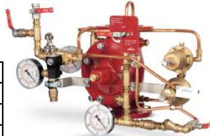
77DE-EL-PORV-PR-MR Manuel Reset