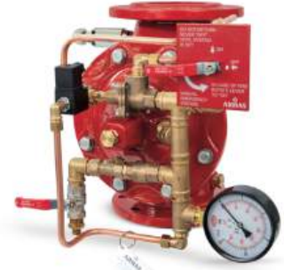
77DE-EL-RR Remote Reset