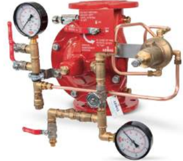
77DE-PN-RR Remote Reset