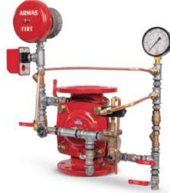
67DE-EL-AL Full Trim Set