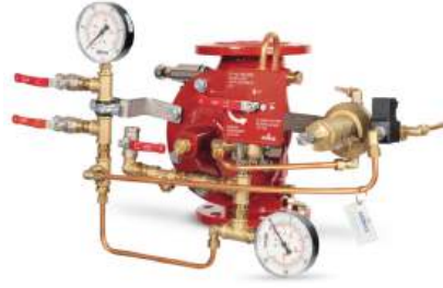
77DE-EL-HRV-MR Manuel Reset